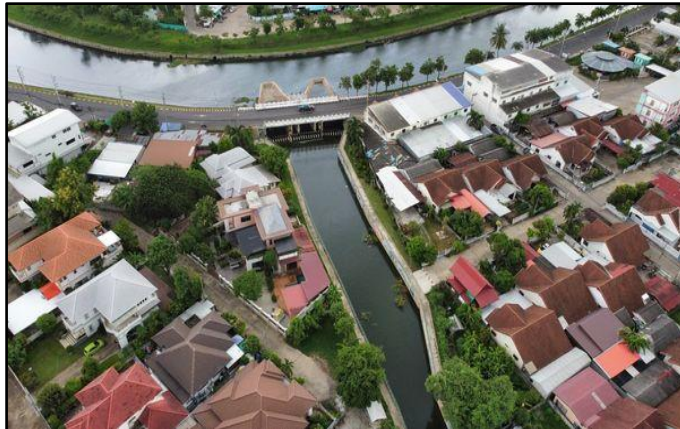
ภาพที่ 1 นวัตกรรมปรับปรุงภูมิทัศน์คูเมืองและกำแพงเมืองโบราณของเทศบาลเมืองร้อยเอ็ด (1)

เทศบาลเมืองร้อยเอ็ดมีนวัตกรรมสังคมที่สำคัญที่สุด คือ “นวัตกรรมปรับปรุงภูมิทัศน์คลองคูเมืองและกำแพงเมืองโบราณ” โดยนวัตกรรมนี้เป็นนวัตกรรมการจัดการสิ่งแวดล้อม เพื่อแก้ไขปัญหาด้านที่อยู่อาศัยที่เป็นชุมชนแออัดและการบุกรุกพื้นที่ทางประวัติศาสตร์บริเวณคลองคูเมืองและกำแพงเมือง โดยการจัดระเบียบที่อยู่อาศัยของประชาชนในเขตเทศบาลเมืองร้อยเอ็ด อำเภอเมืองร้อยเอ็ด จังหวัดร้อยเอ็ด ให้เป็นไปโดยถูกต้องตามกฎหมายและมีความสวยงาม