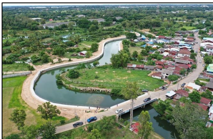
ภาพที่ 2 นวัตกรรมปรับปรุงภูมิทัศน์คูเมืองและกำแพงเมืองโบราณของเทศบาลเมืองร้อยเอ็ด (2)