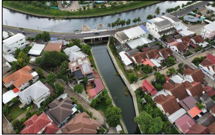
ภาพที่ 3 นวัตกรรมปรับปรุงภูมิทัศน์คูเมืองและกำแพงเมืองโบราณของเทศบาลเมืองร้อยเอ็ด (1)