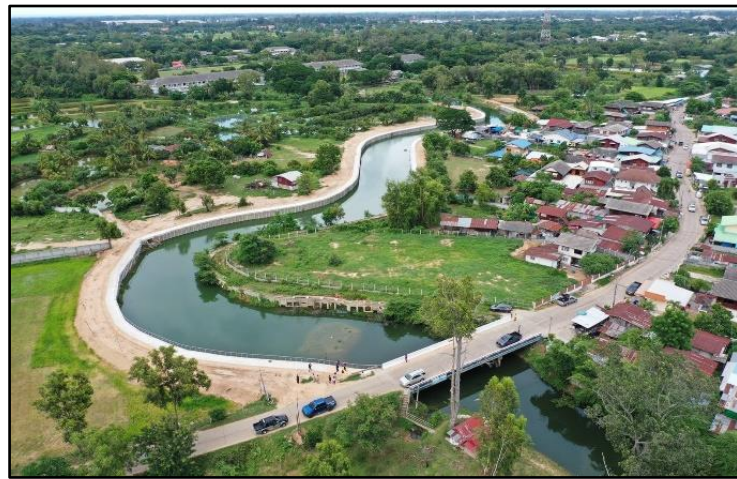
ภาพที่ 4 นวัตกรรมปรับปรุงภูมิทัศน์คูเมืองและกำแพงเมืองโบราณของเทศบาลเมืองร้อยเอ็ด (2)